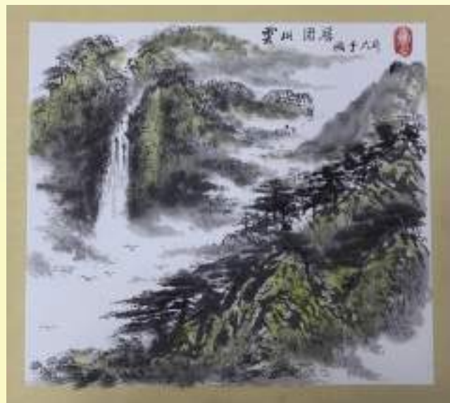
孔宪玉《云山固居》绘画类第三名